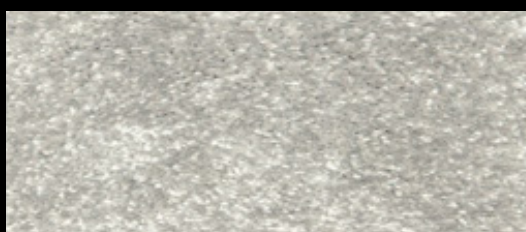
M-42 GRIS CLARO 93