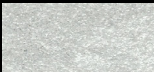
M-42 PLATA 95