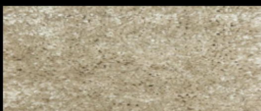
M-42 VISIÓN 47