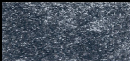
M-42 METAL 77