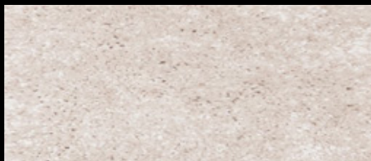
M-42 TAUPE 86

Sistema de fabricación: Tufting Composición de felpa: 100% PA Peso: \pm 2.500 \text{ g/m}^2 Peso total: \pm 3.300 \text{ g/m}^2 Altura felpa: \pm 12,0 \text{ mm} Altura total: \pm 15,0 \text{ mm} Ancho disponible: 2 y 4 m