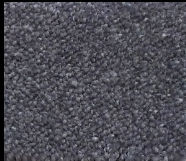
M-44 GRIS OSCURO 302