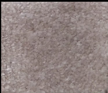
M-44 BEIGE 112