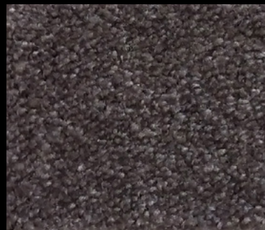
M-44 VISIÓN 309