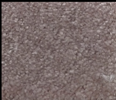
M-44 TOSTADO 115