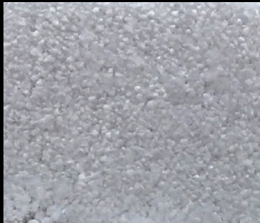
M-44 GRIS CLARO 301